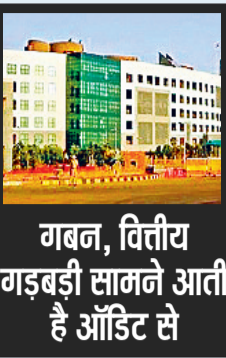
गहन, वित्तीय गड़बड़ी सामने आती है ऑडिट से

संचालनालय संपरीक्षा ने नगरीय प्रशासन एवं विकास विभाग के संचालक को बताया है कि पिछले साल नवंबर 2024 की स्थिति में निकायों पर 15 करोड़ 75 लाख, 72 हजार, 278 रुपये का बकाया है। लेकिन ये राशि बरसों से अदा नहीं की जा रही है। राज्य संपरीक्षा ने जो ब्याज देना है उससे पता लगता है कि कई निकायों ने 10-15 साल से राशि अदा नहीं की है। इनमें सबसे ज्यादा राशि नगर निगमों का है। इनमें सबसे ज्यादा राशि नगर निगमों का है 11 करोड़ 59 लाख, पालिकाओं की 2 करोड़ 35 लाख और नगर पंचायतों की 1 करोड़ 80 लाख से अधिक की है।