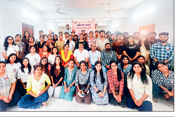
ग्राम भानपुरी में लगाया गया है सात दिवसीय विशेष शिविर