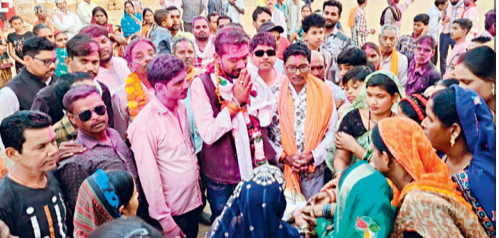
हरिभूमि न्यूज़ ►►अंडा